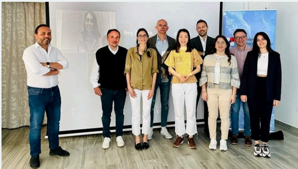
TPM in Malta - 10/05/2024

El proyecto STAY OK está en pleno desarrollo. Hemos llegado ya al ecuador del proyecto y nos encontramos en la fase de desarrollo del curso de formación, que se completará en breve. También se han finalizado ya los primeros resultados del PROYECTO STAY OK, como el informe o los ejemplos de buenas prácticas, que ahora presentamos oficialmente en este boletín. En cuanto a la gestión del proyecto, celebramos la segunda reunión transnacional en Malta, donde debatimos específicamente los contenidos del curso de formación.